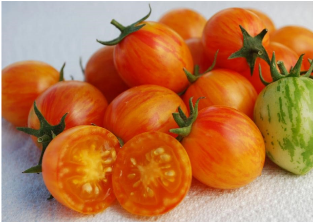
'Golden (Sunrise) Bumble Bee'