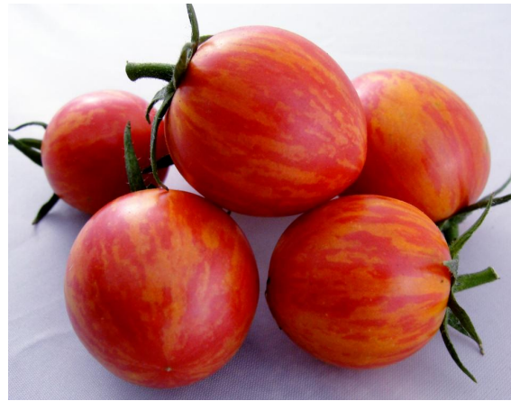
'Pink Bumble Bee'