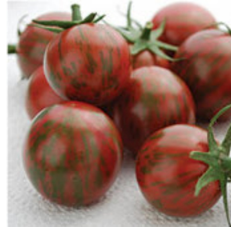
'Purple Bumble Bee'