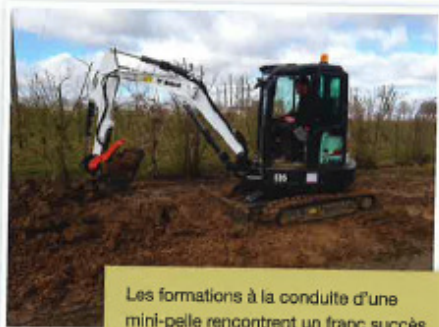
Les formations à la conduite d'une mini-pelle rencontrent un franc succès.