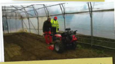
L'offre de formations englobe également des modules plus spécifiques pour les pépinières ou les cultures en serres.