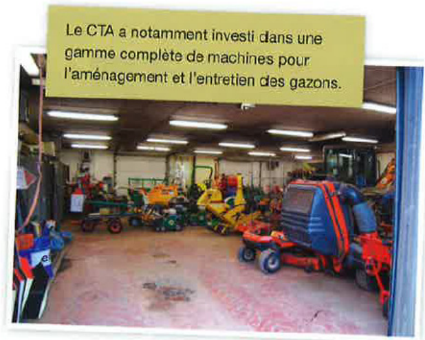
Le CTA a notamment investi dans une gamme complète de machines pour l'aménagement et l'entretien des gazons.

peut adapter la façon de présenter la matière en fonction de son public, et coller ainsi davantage au programme de cours mis en place par l'école. Il connaît de plus ses étudiants et sait comment les intéresser. Notre formateur dispense donc uniquement les formations aux enseignants, mais reste bien entendu disponible pour répondre aux questions ou remarques éventuelles en cours de formation. Pour les enseignants, cette démarche est une opportunité unique d'élargir leurs connaissances et d'aborder la matière d'une manière radicalement différente.'