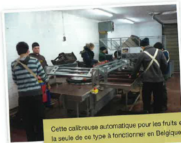
Cette calibreuse automatique pour les fruits est la seule de ce type à fonctionner en Belgique.