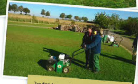
Toutes les machines nécessaires à l'entretien des gazons sont abordées.

accueilli plus de 180 enseignants venus suivre une ou plusieurs formations. De même, plus de 24 écoles ont déjà envoyé des classes se former dans un ou plusieurs domaines. Nous devons encore nous faire un nom, et je dois également dire qu'il n'est pas toujours évident de faire bouger les enseignants et de les sortir de leur 'zone de confort', mais nous sommes sur la bonne voie.'